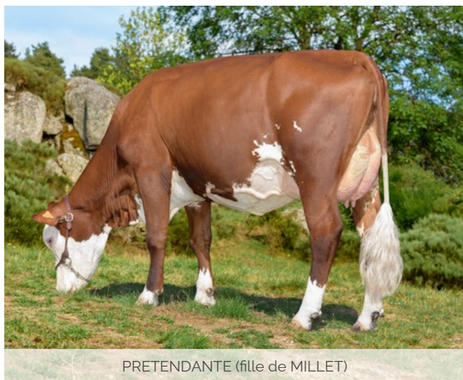
PRETENDANTE (fille de MILLET)