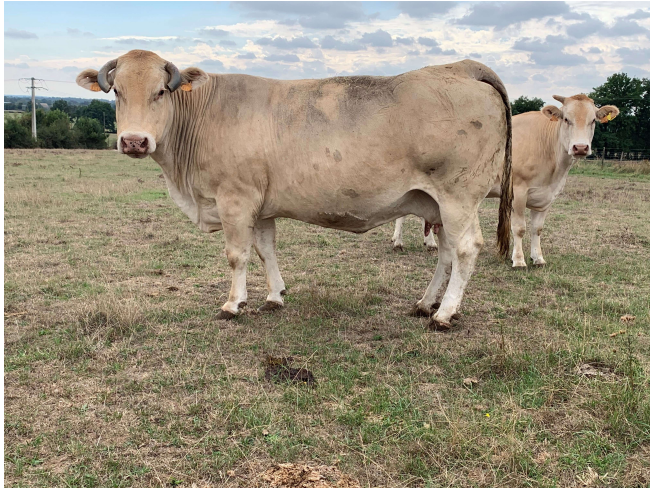
Naisseur: GAEC VILLENEUVE Propriétaire: GAEC VILLENEUVE 79150 ST MAURICE ETUSSON