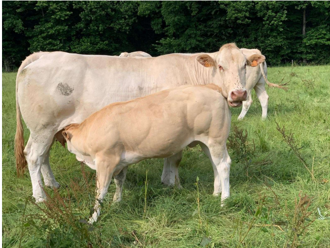
Naisseur: AGRI BLONDES Propriétaire: AGRI BLONDES 22330 PLESSALA