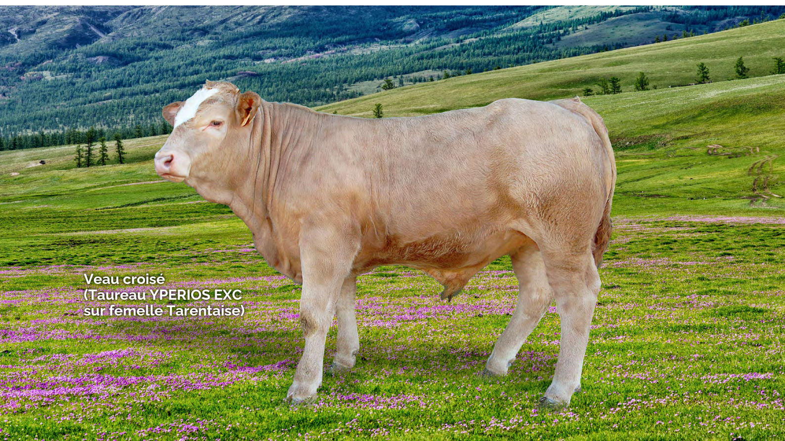
Veau croisé (Taureau YPERIOS EXC sur femelle Tarentaise)

Que ce soit pour les fonctionnels, la morphologie ou la production orientez-vous vers les femelles qui valoriseront le plus votre système et qui correspondent le plus à votre stratégie d'élevage !