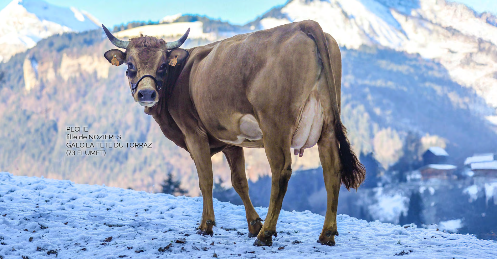
PECHE fille de NOZIERES, GAEC LA TETE DU TORRAZ (73 FLUMET)